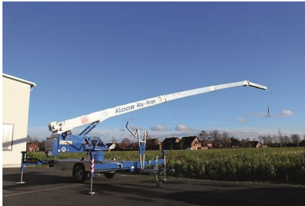
La grue K 23-33 TSR City déployée

ELU PRODUIT DU BTP PAR LES PROFESSIONNELS 2015